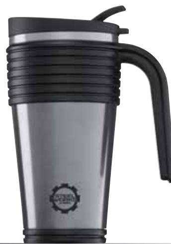
Thermo Mug Silver 0.5L 8199.50