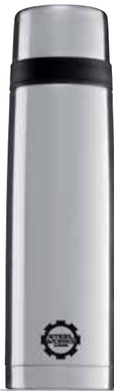
Thermo Classic Line Brushed 0.7L 8298.40