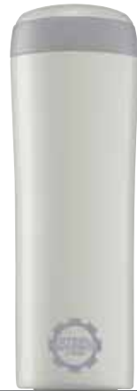
Metro Mug Pearl White 0.25L 8242.10