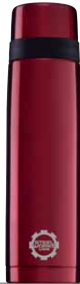
Thermo Classic Line Red 0.7L 8298.60