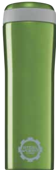
Metro Mug Lime 0.38L 8242.50