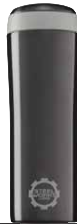
Metro Mug Black 0.25L 8309.50