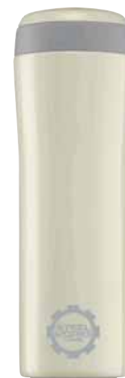
Metro Mug Pearl White 0.38L 8309.20