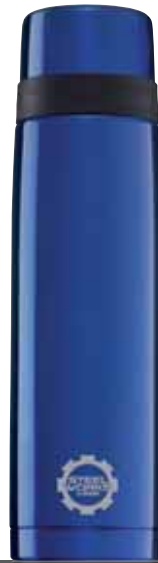
Thermo Classic Line Blue 0.7L 8298.80