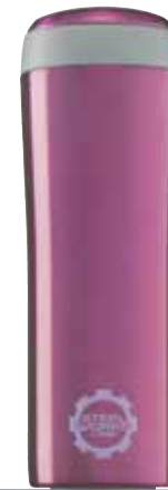
Metro Mug Pink 0.25L 8309.30