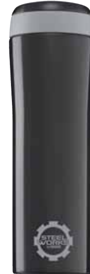
Metro Mug Black 0.38L 8309.60