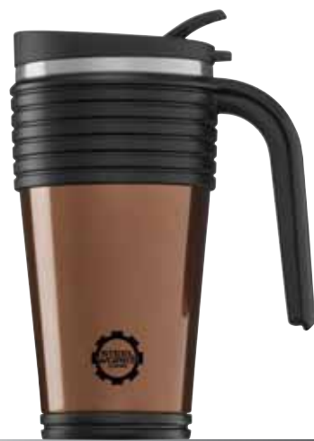
Thermo Mug Copper 0.5L 8242.70

Mod. Dép. DESIGN PROTECTION DESIGNSCHUTZ