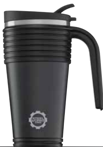
Thermo Mug Black 0.5L 8199.40