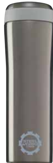
Metro Mug Smoked Pearl 0.38L 8242.60