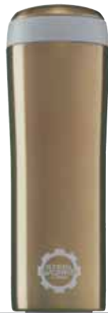
Metro Mug Gold 0.25L 8309.10