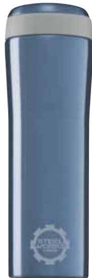
Metro Mug Grey Blue 0.38L 8242.30