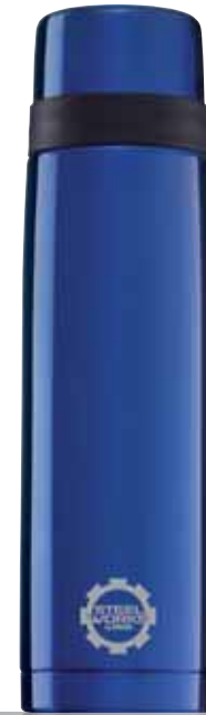
Thermo Classic Line Blue 1.0L 8298.70