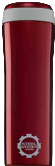
Metro Mug Burgundy 0.38L 8242.40