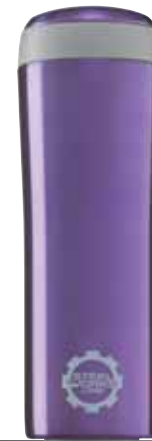
Metro Mug Violet 0.25L 8311.90