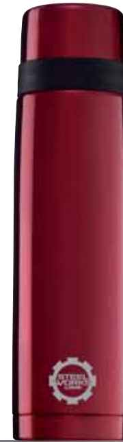
Thermo Classic Line Red 1.0L 8298.50