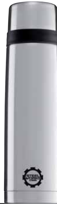
Thermo Classic Line Brushed 1.0L 8298.30